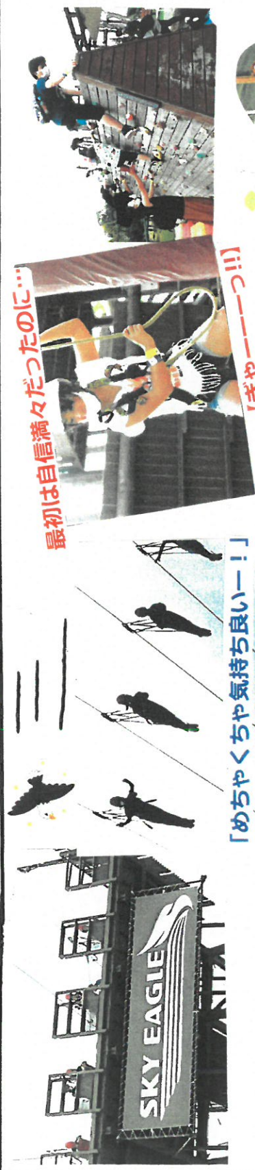
「めちやくちや気持ち良いー!!」