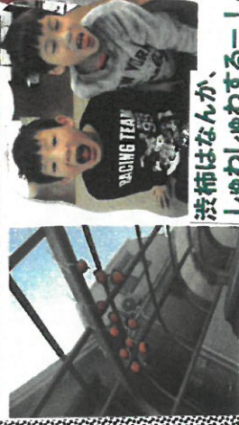
干し柿は、甘くておいしい～