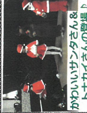
かわいいサントさん&トナカイさんの登場♪