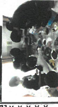
かばんを作りました!