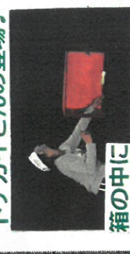
箱の中に入っている物は?!